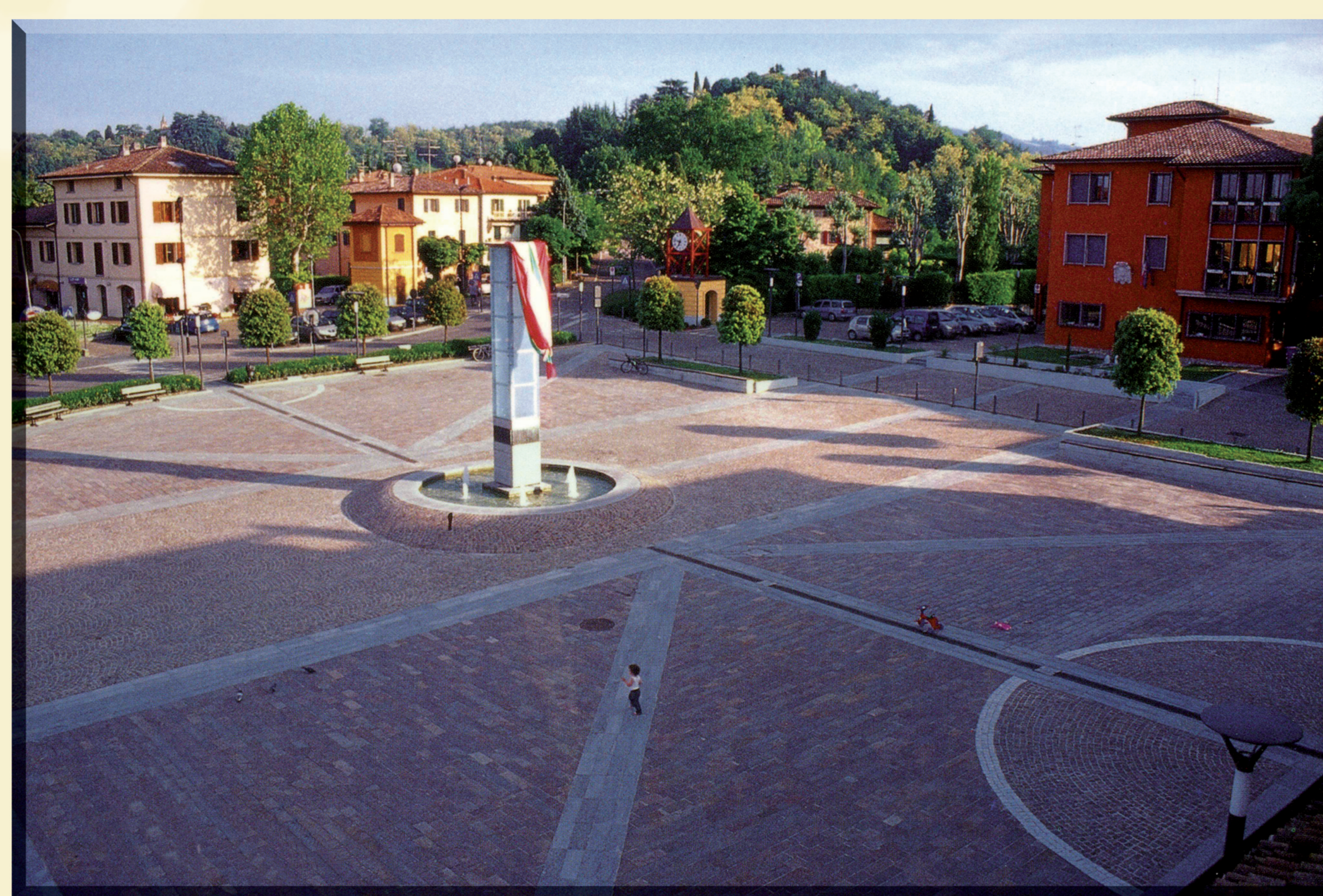
Der zentrale Platz von Albinea mit dem Rathaus (r.)

Albinea liegt in Norditalien, Region Emilia-Romagna, am Fuße der Bergkette des Appennino, wenige Kilometer südlich von Reggio nell'Emilia. Auf 44 km 2 leben rund 8.000 Einwohner. Parma-Schinken, Parmesan-Käse und Lambrusco-Wein haben Ort und Gegend weithin bekannt gemacht.