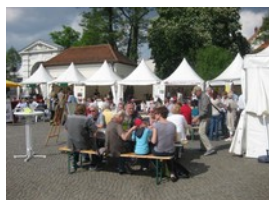
27. - 29. April 2018

14. Köpenicker Winzerfrühling. Wir erwarten mit Freude wieder unsere Winzer und treffen uns am 29. ab 16:00 Uhr zum traditionellen Umtrunk.