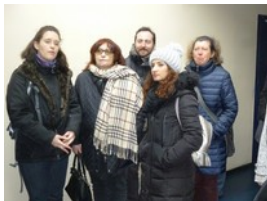
14. - 17. März